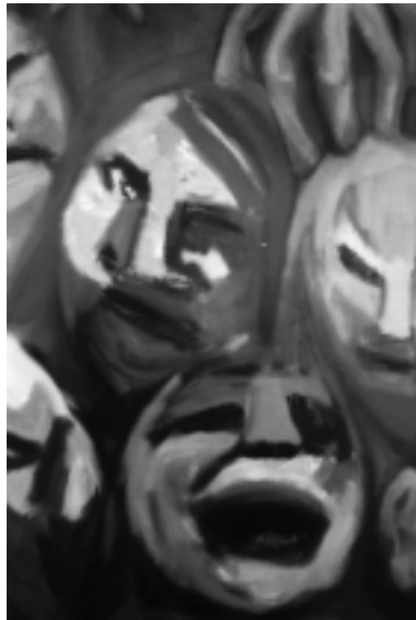
"Nosotros y los Monstruos I" (detalle)

Miércoles 6 de abril a las 19 hs, hasta el 29 de abril de lunes a viernes de 14 a 19